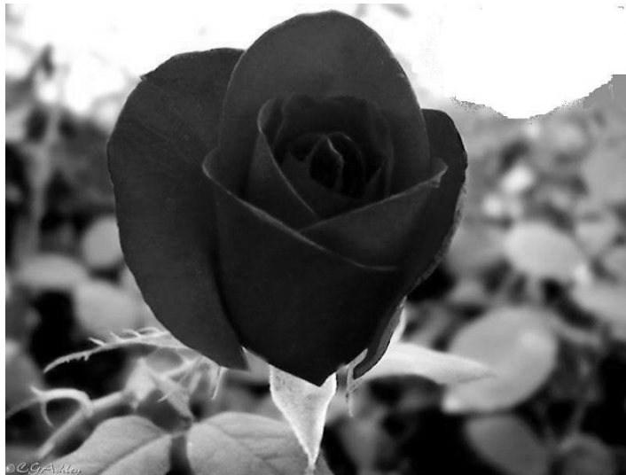
Figura 1 – Flora Brasileira. Rosa (pertence à família Rosácea ).

Obs.: Os dizeres que a acompanham nunca podem ultrapassar o seu tamanho.